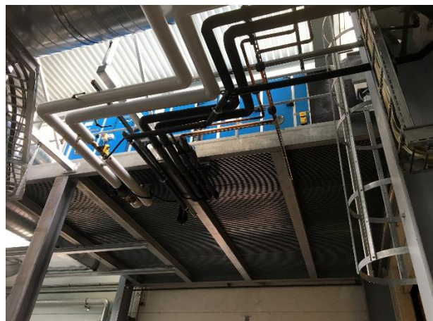
Produktionsmonoblock auf Stahlpodest für Lastwagendurchfahrt