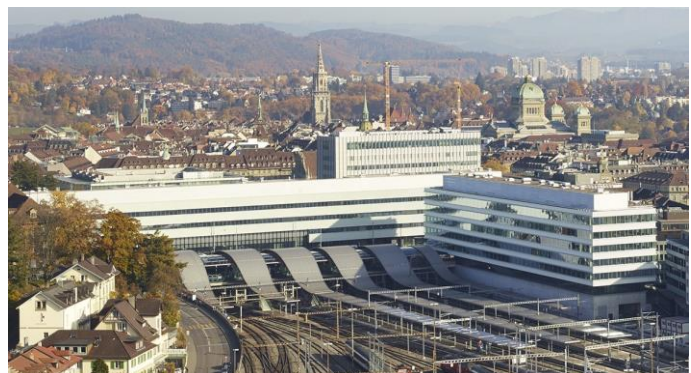
PostParc Bern (Schanzenpost) 2006 – 2015 – Ansicht von Westen