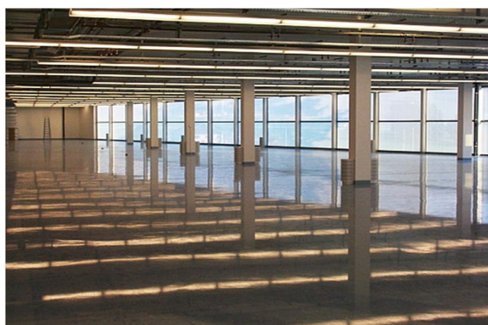
Halle für Feinmontage