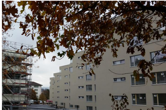
Aussenansicht Baufeld A