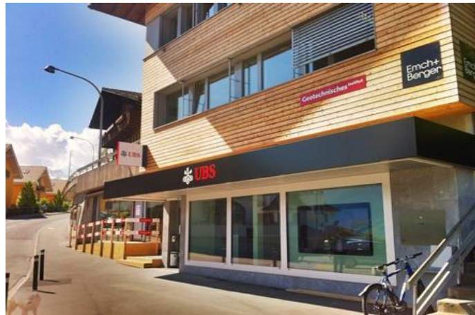
Aussengebäude UBS Spiez