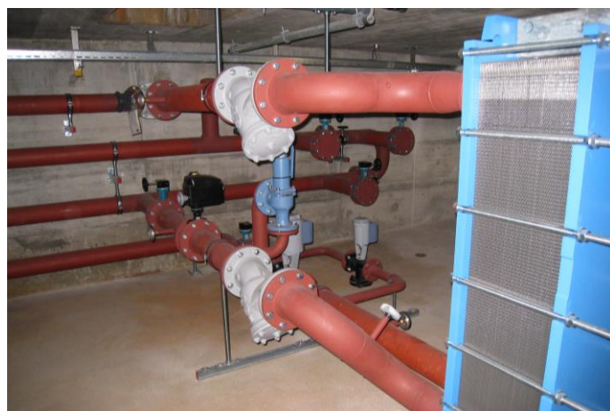
Neue Wärmeübergabestation (N7)