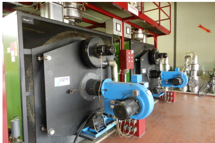
Bestehende Heisswasser-Wärmeerzeugung (N7)